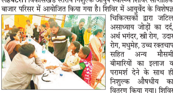
चिकित्सकों द्वारा जटिल असाध्यवा जोड़ों का दर्द, अर्थ भंगदूर, खी रोग, उदर अण, मधुमेह, उच्च रक्तचाप सहित अन्य मौसमी बीमारियों का इलाज व परामर्श देने के साथ ही निशुल्क औषधीय का वितरण किया गया। शिविर में आयुष विभाग द्वारा 359 रोगियों का निशुल्क उपचार कर औषधि बांटी गई तथा 88 रोगियों का रक्त प्रशिक्षण कर मधुमेह जैसी गंभीर बीमारियों का जांच किया गया। साथ ही 179 रोगियों का रक्तचाप बीपी की जांच की गई।

लहपट्टरा। विकासखंड स्तरीय निशुल्क आयुष स्वास्थ्य शिविर साप्ताहिक बाजार परिसर में आयोजित किया गया है। शिविर में आयुर्वेद के विशेषज्ञ चिकित्सकों द्वारा जटिल असाध्यवा जोड़ों का दर्द, अर्थ भंगदूर, खी रोग, उदर अण, मधुमेह, उच्च रक्तचाप सहित अन्य मौसमी बीमारियों का इलाज व परामर्श देने के साथ ही निशुल्क औषधीय का वितरण किया गया। शिविर में आयुष विभाग द्वारा 359 रोगियों का निशुल्क उपचार कर औषधि बांटी गई तथा 88 रोगियों का रक्त प्रशिक्षण कर मधुमेह जैसी गंभीर बीमारियों का जांच किया गया। साथ ही 179 रोगियों का रक्तचाप बीपी की जांच की गई।