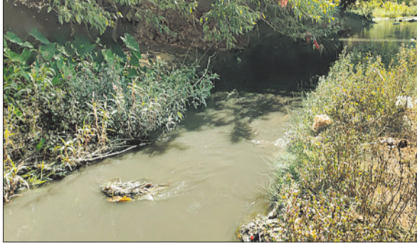
नाले का दूषित पानी।

इस कारण अंतिम संस्कार जैसे पवित्र संस्कारों के संपादन में भारी परेशानियां सामने आ रही हैं। स्थानीय लोगों के अनुसार मुक्तिधाम से होकर बहने वाला यह पानी नाले से जुड़ा हुआ है, जिसमें गंदगी, कचरा और दुर्गंध युक्त पानी लगातार मिल रहा है। घाट परिसर में बदबू फैल रही है, वहीं पानी का रंग भी काला पड़ चुका है। हालात इतने खराब हैं कि धार्मिक विधि-विधान